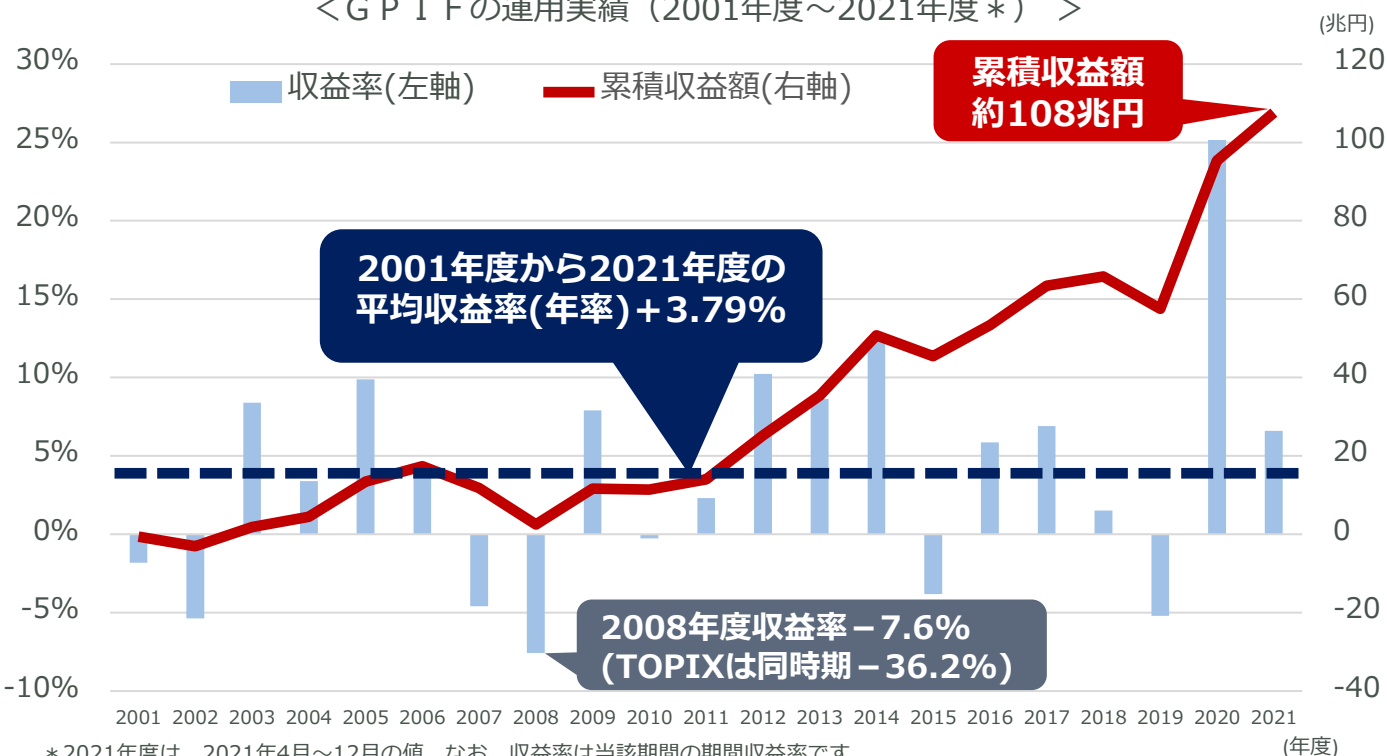
<GPIFの運用実績 (2001年度~2021年度*) >

* 2021年度は、2021年4月~12月の値。なお、収益率は当該期間の期間収益率です。